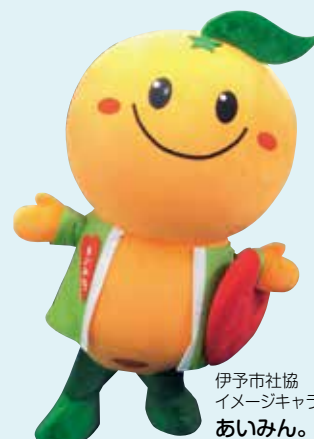
伊予市社協 イメージキャラクター あいみん。

伊予市社協では、皆さまからいただいた会費、寄附金、共同募金などを財源に地域福祉を推進しています。決算報告とともに、当社協が取り組んだ主な事業をご紹介します。