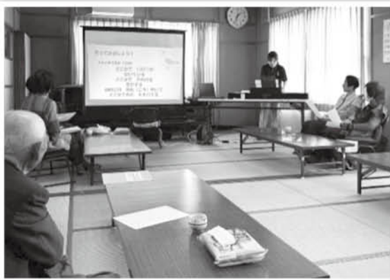
▲市ノ坪ふれあいサロン